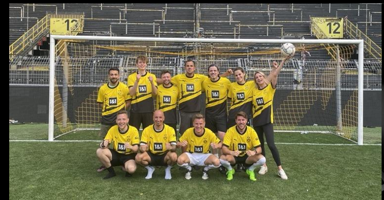
KICK IM SIGNAL IDUNA PARK