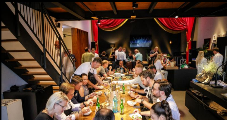
GEMEINSAMES KOCHEN MIT DEM BVB-MANNSCHAFTSKOCH