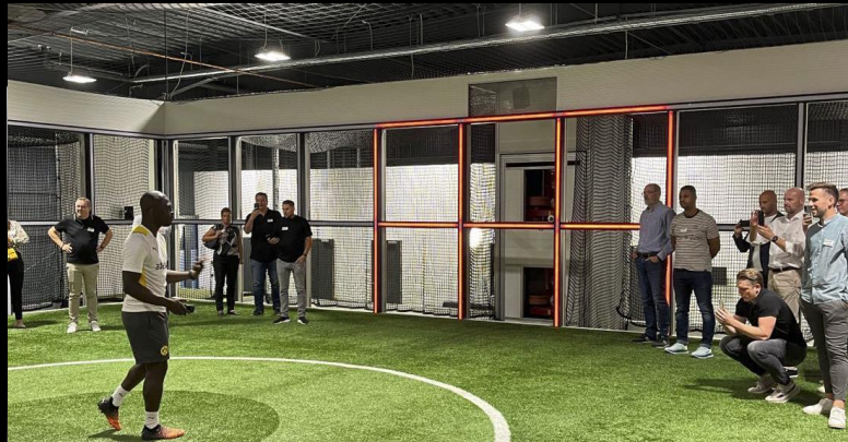
EXKLUSIVE EINBLICKE IN DEN BVB-KOSMOS