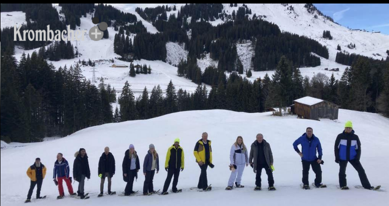
SKIREISE IN DIE KITZBÜHELER ALPEN